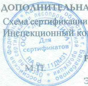
Схема сертификации – ЗС. Инспекционный контроль – июль 2020 года, июль 2021 года.